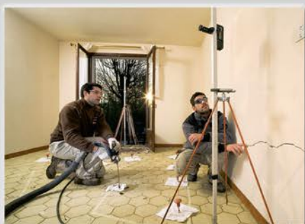
Relevage du dallage