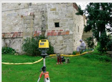
Intervention sous contrôle laser