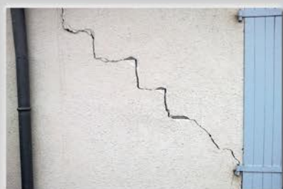
Fissure en escalier