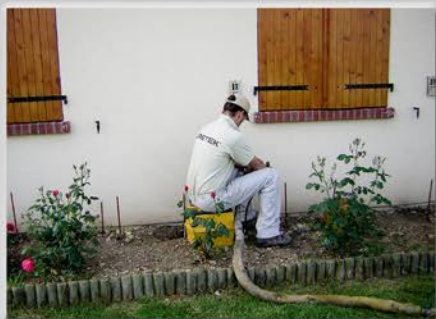
Réalisation d'une injection